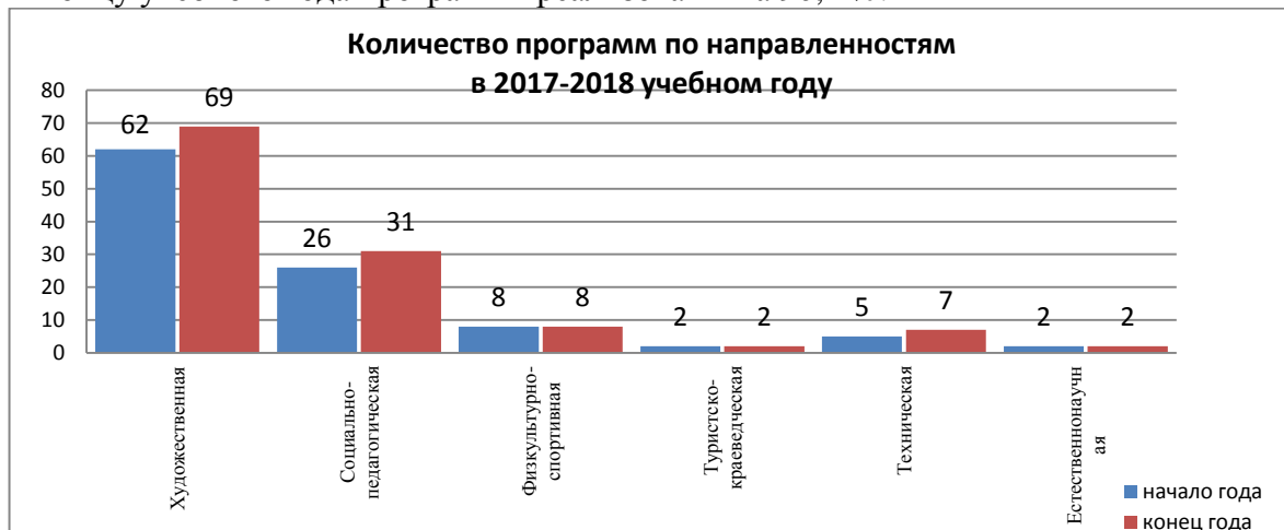
Рисунок 2. Количество программ по направленностям

К концу учебного года программы реализованы на 96,4 %.