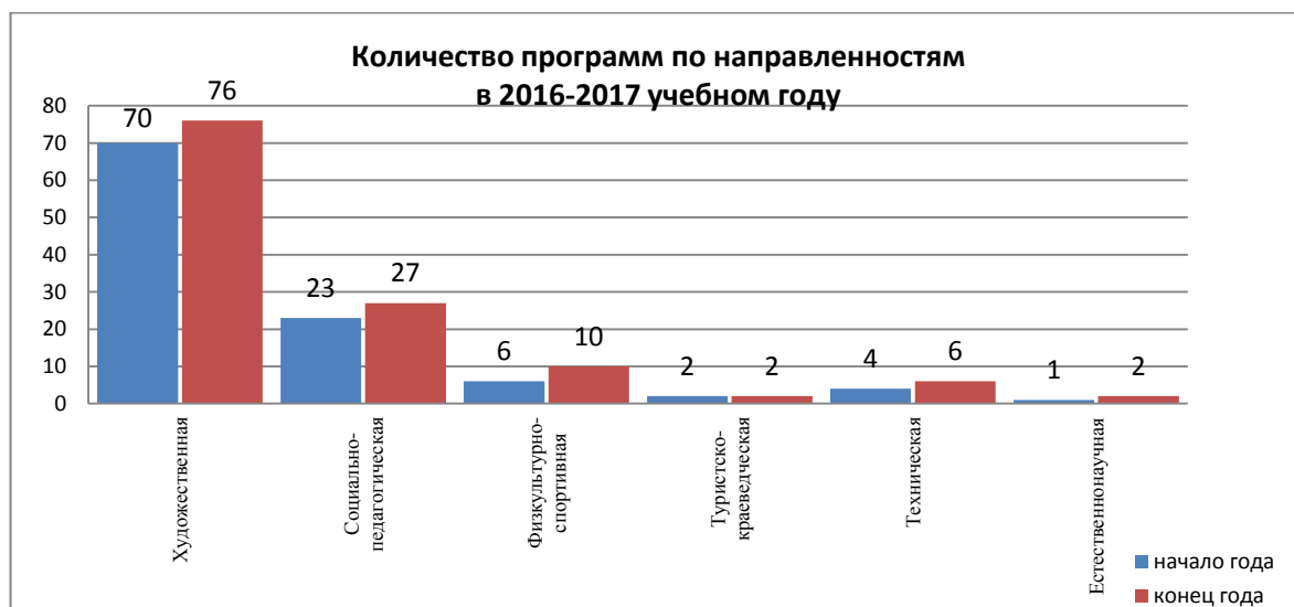
Рисунок 2. Количество программ по направленностям

К концу учебного года программы реализованы на 96 %.