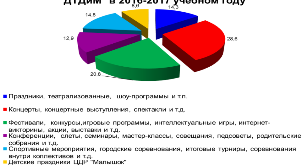
Рисунок 5 Массовые мероприятия, проведенные в МУ ДО «ДТДиМ» в 2016-2017 уч. г.

Итого проведено 385 мероприятий. Обслужено около 30 тысяч человек.